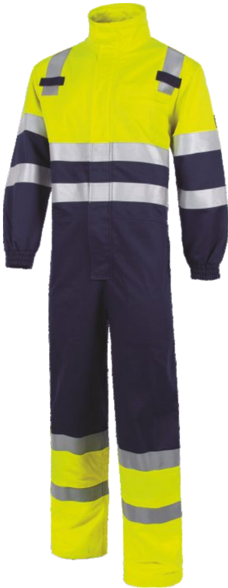
Bleu Marine/Jaune H.V. Marinho/Amarelo A.V.