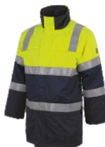
Bleu Marine/Jaune H.V. Marinho/Amarelo A.V.