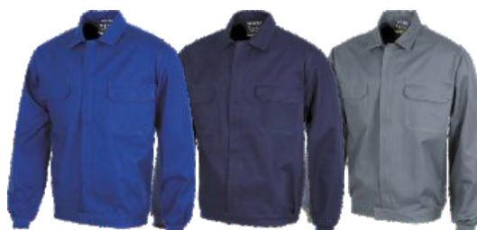
Bleu Royal Azulina