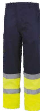
Bleu Marine/Jaune H.V. Marinho/Amarelo A.V.