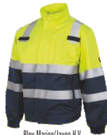
Bleu Marine/Jaune H.V. Marinho/Amarelo A.V.