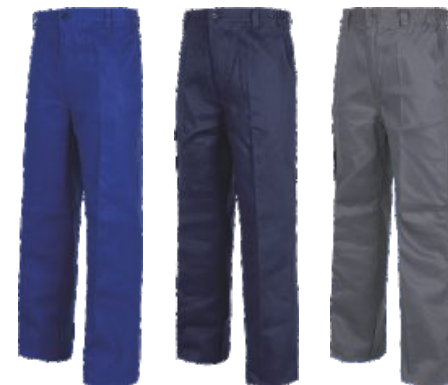
Bleu Royal Azulina