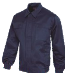
Bleu Marine Marinho