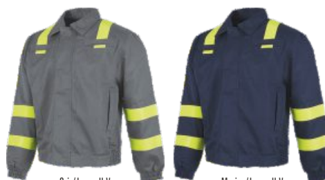
Gris/Jaune H.V. Cinza/Amarelo A.V.