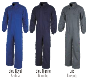
Bleu Royal Azulina