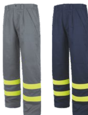
Gris/Jaune H.V. Cinza/Amarelo A.V.