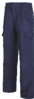
Bleu Marine Marinho