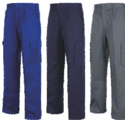
Bleu Royal Azulina