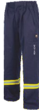
Bleu Marine Marinho