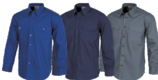
Bleu Royal Azulina