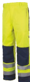
Jaune H.V./Bleu Marine Amarelo A.V./Marinho