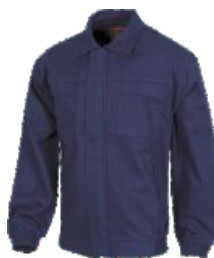
Bleu Marine Marinho