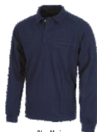
Bleu Marine Marinho