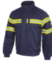
Bleu Marine Marinho