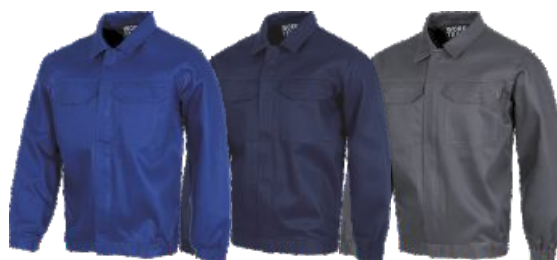
Bleu Royal Azulina