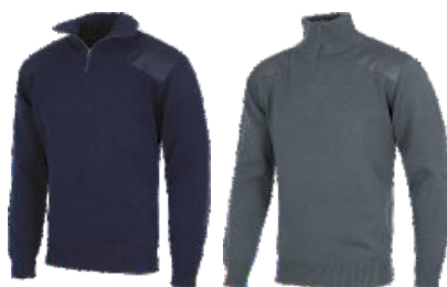
Bleu Marine Marinho