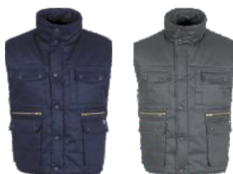
Bleu Marine Marinho