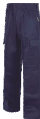
Bleu Marine Marinho