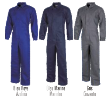
Bleu Royal Azulina