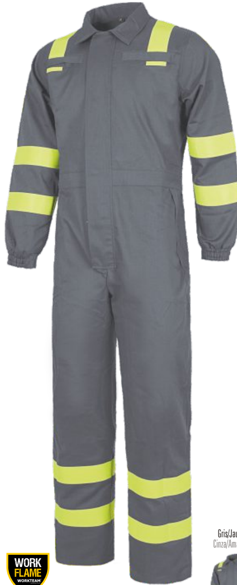
Gris/Jaune H.V. Cinza/Amarelo A.V.

Fato macaco com fecho de correr de metal oculto por baixo da lapela com fecho de colchetes ocultos. Gola alta. Um bolso no peito e dois nas costas com fecho de correr oculto. Fitas refletoras no peito, nas costas, mangas e ombros. Elástico nos punhos. Combinada com alta visibilidade.