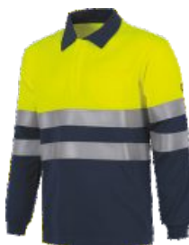
Bleu Marine/Jaune H.V. Marinho/Amarelo A.V.